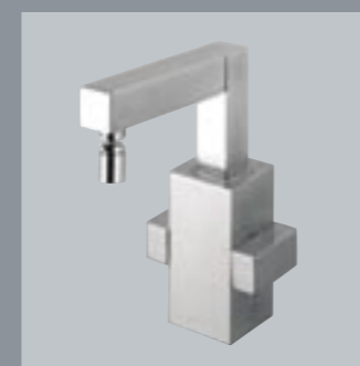
42460 Gruppo monoforo per bidet One hole bidet set