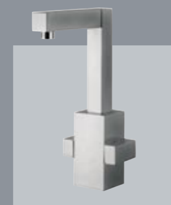
42360 Gruppo monoforo per lavabo One hole wash basin set