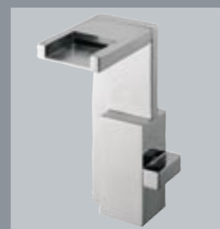
42380 Gruppo monoforo per lavabo con bocca a cascata e cartuccia progressiva One hole wash basin set with waterfall spout and progressive cartridge