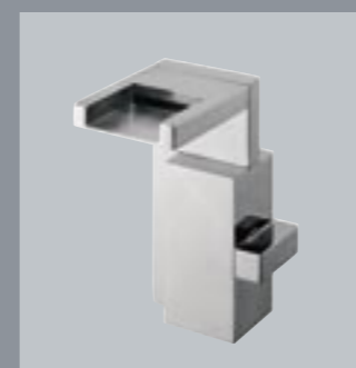
42480 Gruppo monoforo per bidet con bocca a cascata e cartuccia progressiva One hole bidet set with waterfall spout and progressive cartridge