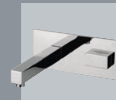
42690 Gruppo a parete per vasca/lavabo con cartuccia progressiva Wall mtg. bathtub/wash basin set with progressive cartridge