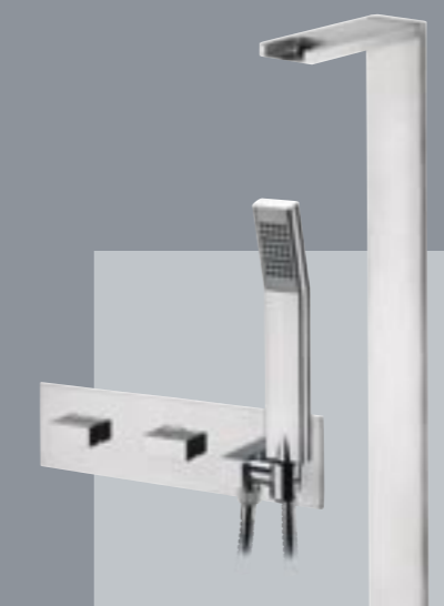
42290 Gruppo per vasca con bocca a cascata da pavimento cartuccia progressiva, deviatore, presa d'acqua con doccia e supporto a parete Floor mounted bath filler with wall mtg. Progressive cartridge, diverter, water supply flange and stand for shower