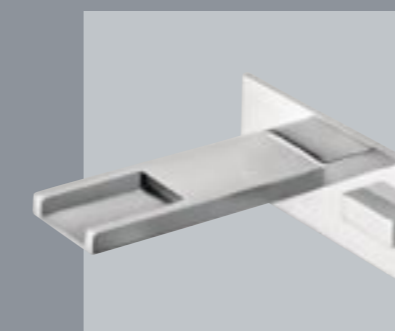
42670 Gruppo a parete per vasca/lavabo con bocca a cascata e cartuccia progressiva Wall mtg. bathtub/wash basin set with waterfall spout and progressive cartridge